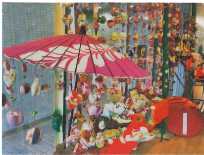
過去の展示の様子